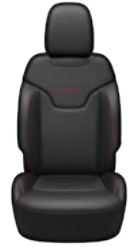
WENTYLOWANA CZARNA SKÓRA ZE SZWAMI DIESEL GREY