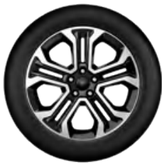
Aluminiowe obręcze kół 18" FREEDOM EDITION I (standard)