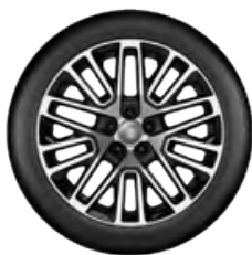
Aluminiowe obręcze kół 19" FREEDOM EDITION II (standard)